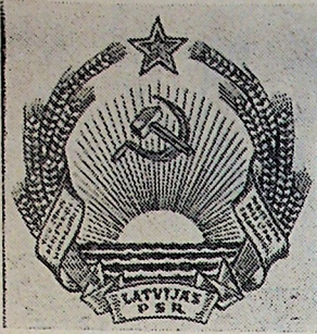
Герб Латвийской ССР.

«Союз Советских Социалистических Республик — единое союзное многонациональное государство, образованное в результате свободного самоопределения наций и добровольного объединения равноправных Советских Социалистических Республик».