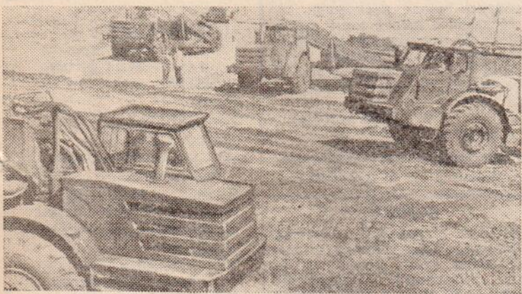
ТОЛЬЯТТИ. В окрестностях этого волжского города развернулось строительство гигантского комбината плодородия — Тольяттинского азотного завода.

Предприятие будет производить аммиачные удобрения. К концу десятой пятилетки этот гигант большой химии вступит в строй.