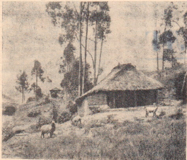
Газета выходит по вторникам, четвергам и субботам.

ЭКВАДОР. Так выглядит ранчо эквадорского крестьянина. В настоящее время бананы — основной сельскохозяйственный продукт страны. Они составляют более половины всего экспорта. Крестьяне Эквадора страдают от нехватки земли, большая часть которой принадлежит помещикам.