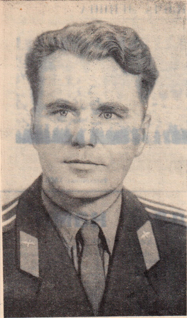
Советский летчик-космонавт подполковник ШАТАЛОВ Владимир Александрович, командир космического корабля «Союз-4».