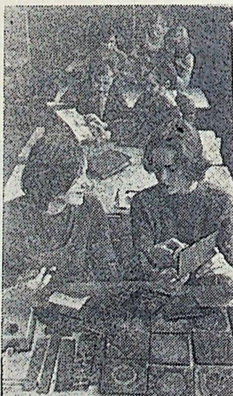
ЭСТОНСКАЯ ССР. Многие школы республики, добившиеся лучших успехов в эстетическом воспитании, будут участвовать в изготовлении подарков для братских республик или городов, с которыми установлены дружеские связи. Это мероприятие подготавливается к 100-летию со дня рождения В. И. Ленина.

Таллинская 24-я средняя школа является одной из них. В этом единственном в республике учебном заведении ребята осваивают разные виды прикладного искусства. За опытом сюда приезжают из многих городов нашей страны. Уроки труда в школе тесно связаны с эстетическим воспитанием.