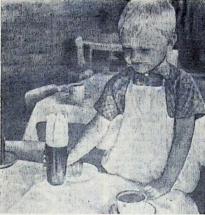
СЕГОДНЯ Я ДЕЖУРИЮ.