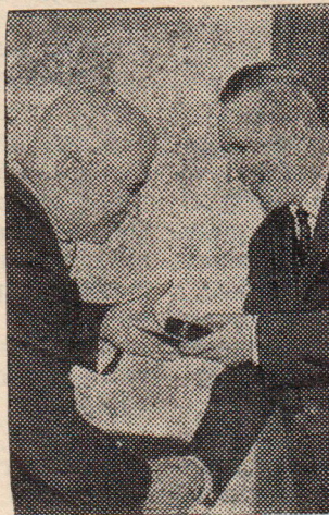
И. Г. Петровскому (слева) диплом и знак члена-корреспондента Академии СРР.

ШОФЕР в Тотемский Дом ребенка. Справляться по адресу: гор. Тотмее, Советская 51, с 9 до 17 часов.