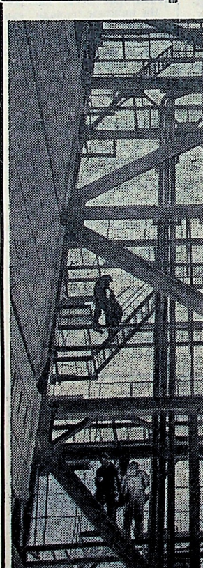
В энергосистему Узбекистана дал промышленный ток третий турбогенератор Ташкентской ГРЭС. Мощность его—150 тысяч киловатт.