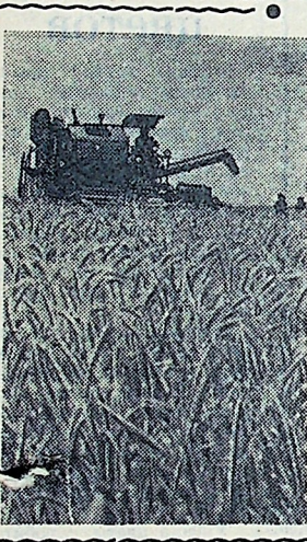
Жатва хлебов началась в Сальянской степи Азербайджанской ССР.