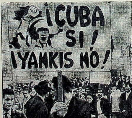
КОЛУМБИЯ. Богота. Демонстрация рабочих на площади Боливара в знак солидарности с Кубой. Демонстранты несут плакаты: «Куба — да, янки — нет!», «Единство действий против дороговизны, низ-

кой заработной платы и безработицы», «За самоопределение народов», «Единство трудящихся приведет к победе».