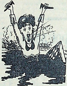
И так бывает...

На некоторых улицах Тотьмы с наступлением весны стало очень грязно. (Из писем).