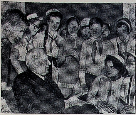
Во время Недели детской книги учащиеся столицы встретились с любимыми писателями и познакомились с новыми книгами. На снимке: писатель Корней Чуковский беседует с ребятами.