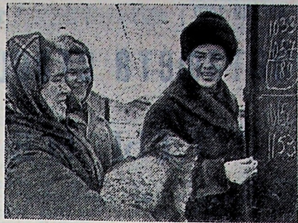
«Фабрикой пушного золота» называют зверосовхоз «Кольский», один из крупнейших в стране. Отлично поработал коллектив звероводов в минувшем году. Только сверхплановой прибыли от реализации пушнины получено 157 тысяч рублей.

На Пленуме со всей полнотой освещены вопросы дальнейшего организационно-хозяйственного укрепления колхозов и совхозов, материальных и моральных стимулов работников сельского хозяйства.