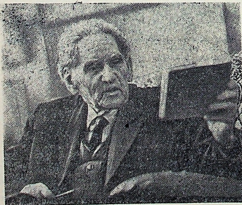
28 февраля исполнилось 85 лет народному художнику СССР, лауреату Ленинской премии, действительному члену Академии художеств СССР Мартиросу Сергеевичу Сарьяну.

На снимке: М. С. Сарьян в мастерской.