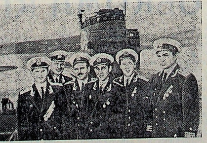
На снимке: переводы офицеры соединения подводных лодок Тихоокеанского флота.

КРУШИНСКИЙ А. С. Взрывы над Днепром. (Рассказ о выдающемся руководителе партизанской борьбы в Белоруссии К. С. Заслонове). Госполитиздат, 1963. 136 стр.