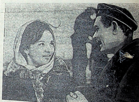
Москва. 50-летию Великой Октябрьской социалистической революции студия «Ленфильм» посвящает свой фильм «Залп Авроры».