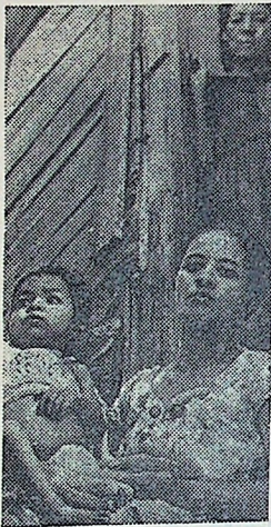
Богатый край бедняков — так называют Венесуэлу. Большая часть населения этой маленькой, но щедро наделенной природой страны влечит полуцивилизированное существование. По официальным сведениям, ежегодно от голода в стране умирают сотни человек. Очень плохо поставлено медицинское обслуживание. Особенно пагубно это отражается на детях: каждый год только от заболеваний легких умирает 4 тысячи детей до четырехлетнего возраста. На снимке: семья бедняков.

В сегодняшней беседе мы расскажем о положении в Адене, английской колонии на юге Аравийского полуострова. Иностранцы телеграфные агентства передают, что улицы Адены, главного города колонии, напоминают поле боя. Английские войска применяют против аденцев оружие и слезоточивый газ. Среди гражданского населения имеются жертвы. Каждый день в порт Адены морем и по воздуху прибывают новые подкрепления карателей.