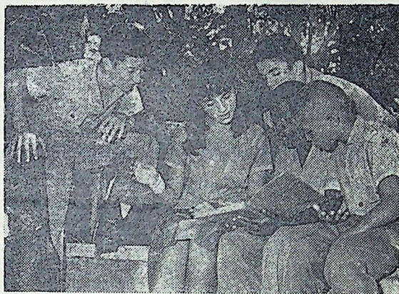
Правительство Кубы уделяет огромное внимание детям. Оно заботится о том, чтобы дать им общее образование, о том, чтобы юные граждане острова Свободы были всесторонне развитыми и культурными людьми. В стране созданы школы, в которых юноши и девушки могут заниматься музыкой, живописью, драматическим искусством, балетом. На снимке: группа учеников национальной художественной школы (провинция Гавана) во время перемены.

И. С. ВАРУНЦЯ, академик-секретарь отделения земледелия ВАСХНИЛ. (ТАСС.)