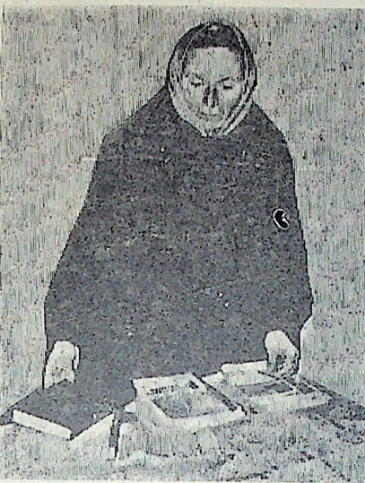
Читатели о книгах