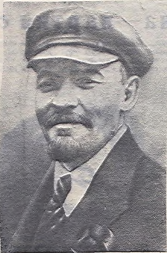
В. И. Ленин. 1920 год.

как сейчас на портрете. Ленин смотрел на ребят. В комнате стало еще тише. Все вглядывались в дорожное и близкое лицо со знакомым прищуром глаз.