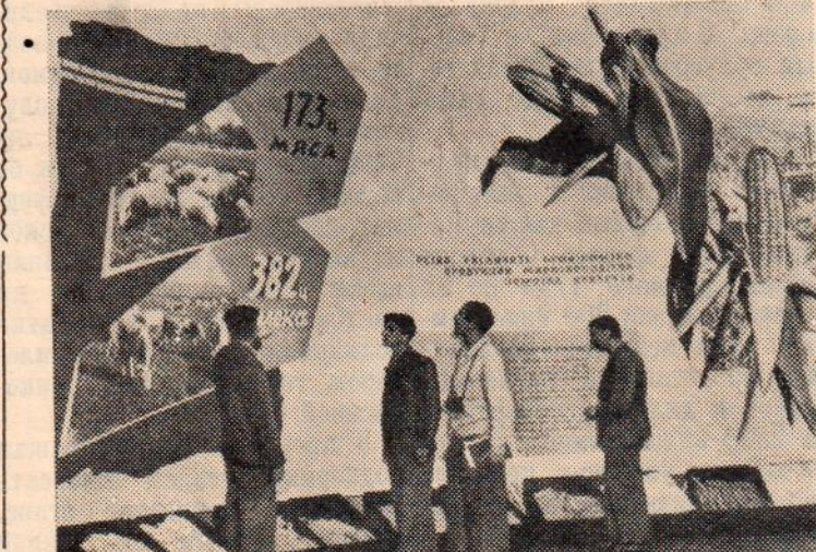
колхозники планируют получать на каждые 100 гектаров угодий 900 центнеров молока и 250 центнеров мяса.