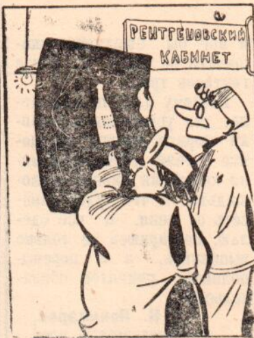
Злокачественная опухоль. Рис. А. Цветкова.