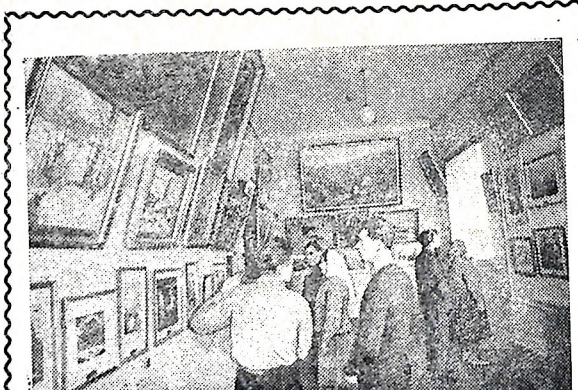
Ростовская область. Во Дворце культуры колхоза имени Сталина Неклиновского района открылась недавно художественная галерея, в которой собрано более 80 произведений живописи, графики и скульптуры, созданных ростовскими художниками.

На снимке: в художественной галерее колхоза имени Сталина.