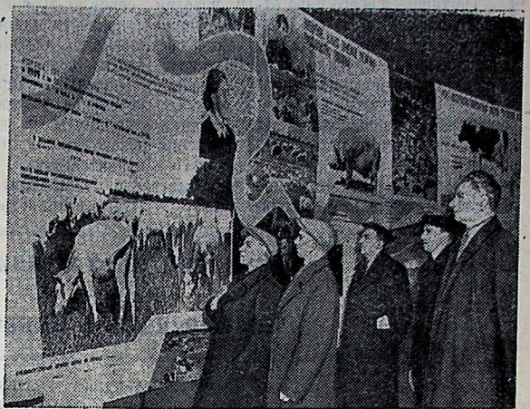
Открытая на ВДНХ экспозиция «Победа рязанцев», рассказывающая о высоких достижениях животноводов Рязанской области, пользуется большим успехом у посетителей.

На снимке: посетители у стендов, показывающих достижения колхоза «Крестьянский труд». Этот колхоз в 1959 году продал государству 226 тонн мяса — в семь раз больше, чем в 1958 году. Колхоз в 1959 году на 100 гектар сельскохозяйственной земли произвел 163 центнера мяса и 416 центнеров молока.