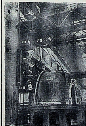
На снимке: в паротурбинном цехе Харьковского завода имени Кирова. Механическая обработка нижней половины цилиндра среднего давления паровой турбины мощностью в 300 тысяч киловатт.