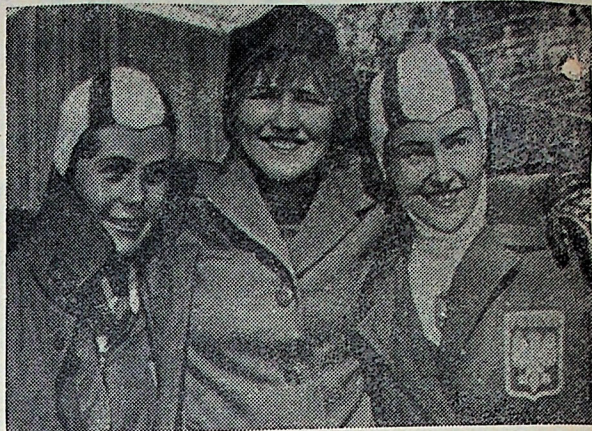
США. Скво Вэлли.