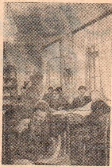
Ровенская область. В районном центре Демидовке построен Дом культуры со зрительным залом на 500 мест, комнатами для занятий кружков художественной самодеятельности, библиотекой и читальным залом.