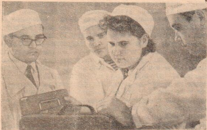
Киев. В начале этого года вступил в строй атомный реактор Института физики Академии наук Украинской ССР. Он является одним из лучших в стране модернизированных экспериментальных реакторов и имеет мощность 10000 квт.

Сейчас идет подготовка всего технологического комплекса оборудования к проведению научно-исследовательских работ.