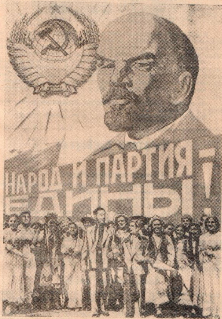
Фотоплакат художника Б. Антонова.

Благородные идеи социалистического демократизма все больше овладевают умами лю-