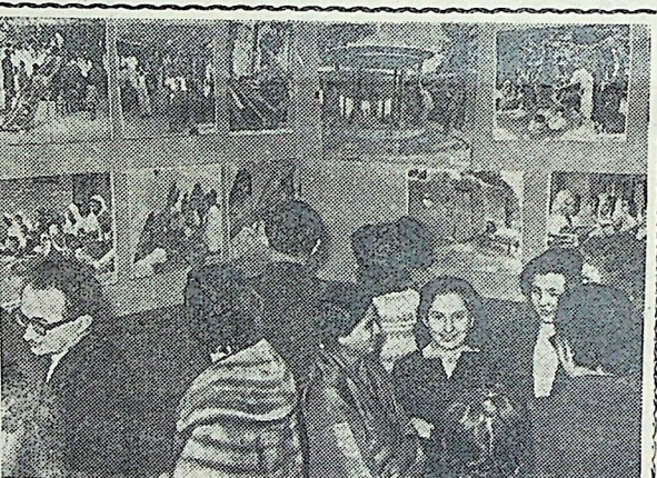
Москва. В ДOME дружбы с народами зарубежных стран открылась фотографическая выставка «Заботы о женщинах и детях Индии». Выставка подготовлена Всендийским советом общественного благосостояния. На снимке: на выставке.