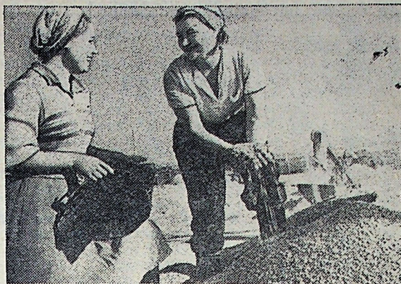
АЛТАЙСКИЙ КРАЙ. В дни предоктябрьского социалистического соревнования на полях, стоках и элеваторах царит небывалый трудовой подъем. Близки к выполнению своего обязательства новоселы целинного совхоза «Комсомольский». Они стремятся сдать государству один миллион пудов хлеба.