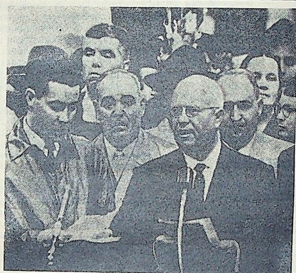
Нью-Йорк. Н. С. Хрущев выступает с заявлением для представителей американской, советской и иностранной прессы, радио и телевидения. Справа налево: товарищи Тодор Живков, Н. С. Хрущев и Г. Георгиу-Деж.

Н. С. Хрущев начал свое выступление с общей политической дискуссии. Делегаты с огромным интересом слушали историческое выступление Н. С. Хрущева, содержащее глубокий анализ современного этапа истории человечества, широкий конкретный план укрепления мира, разрешения проблемы разоружения.