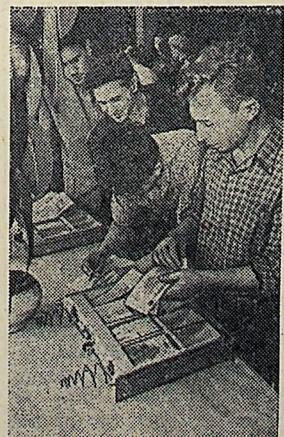
Рязань. Участку узловой сборки кассовых аппаратов Рязанского завода счетно-аналитичес-