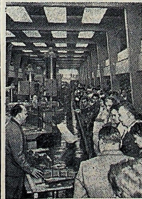
Москва. На промышленной выставке Венгерской Народной Республики.