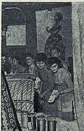
В Москве, в парке культуры и отдыха «Сокольники», открылась впервые устраиваемая в СССР японская промышленная выставка.

На снимке: посетители выставки знакомятся с экспонатами отдела синтетических волокон.