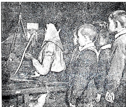
Рязанская область. Неизменно изменилась за годы Советской власти жизнь труженников села отсталой и нищей в прошлом Рязанской губернии. Сейчас колхозные села застроены добротными благоустроенными домами с электричеством и радио. Почти каждая семья имеет телевизор, красивую городскую мебель. Зажиточно и культурно живут рязанские колхозники.

Теперь только в областном краеведческом музее можно увидеть убогую обстановку старой крестьянской избы.