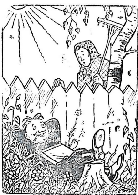
— Ты что тут даром время теряешь? — Как даром? Мне трудодни начисляются! Рис. В. Лыскова.