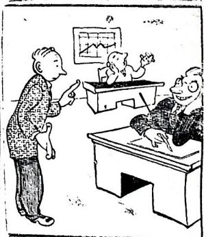
— И зачем же ты, Лука, взял на службу чудака? Где был твой ум? — Коршнь напрасно: он мне кум! Рис. Ю. Федорова.