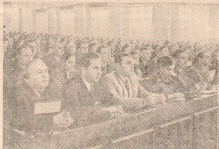
Москва. С 23 марта по 27 марта в Большом Кремлевском дворце проходил XII съезд профессиональных союзов СССР. На снимке: в зале заседаний съезда.