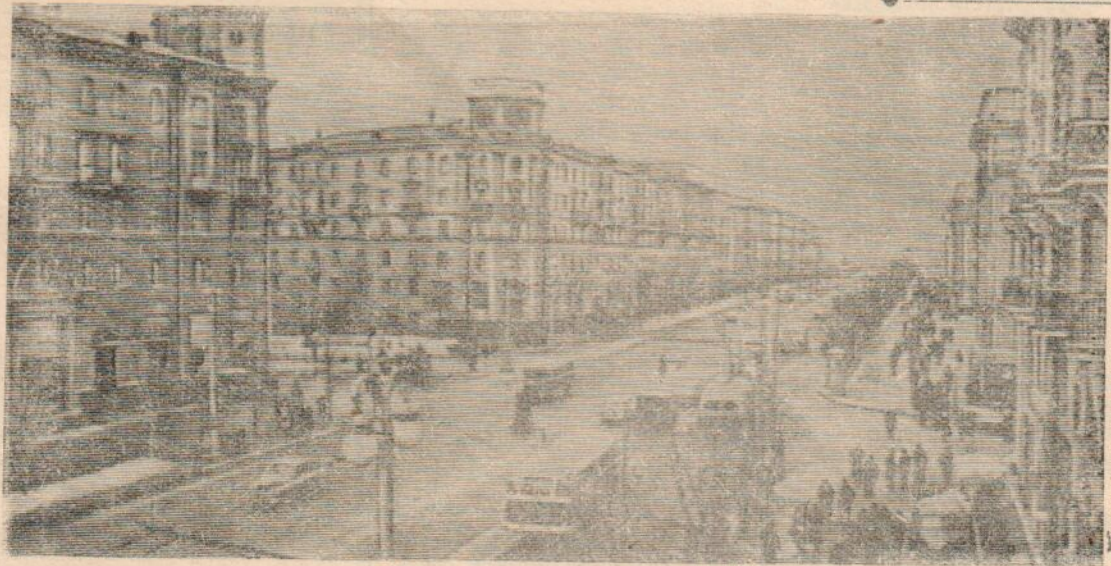
40 лет Белорусской ССР

Работать по-чуриловски — это значит добиться досрочного выполнения январского и квартального планов всеми лесопунктами. В. Васильев.