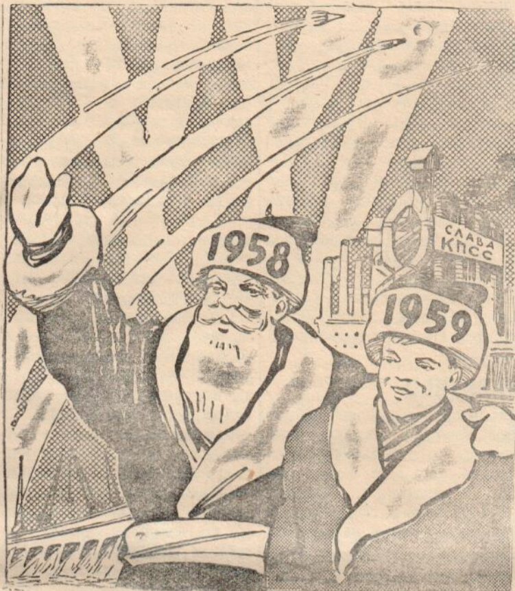
Рис. В. Жарнинова.