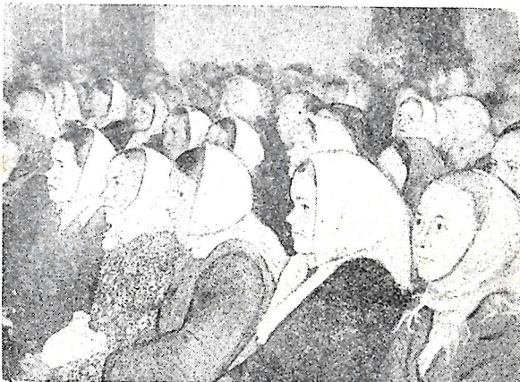
На снимке: в зале Дома культуры 24 сентября с. г. участники районного совещания передовиков животноводства.