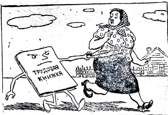
—Я—супруга бригадира. Мне не нужно трудодня, отвяжитесь от меня!

Очень плохо с откормом и нагулом скота решается вопрос в колхозах имени Молотова, Калининского сельсовета, «1-е Мая» Пятавского сельсовета, «Сталинский призыв». Здесь скот думают сдавать опять только в августе—сентябре. А следовало бы над этим вопросом подумать посерьезнее. К. Александрова.