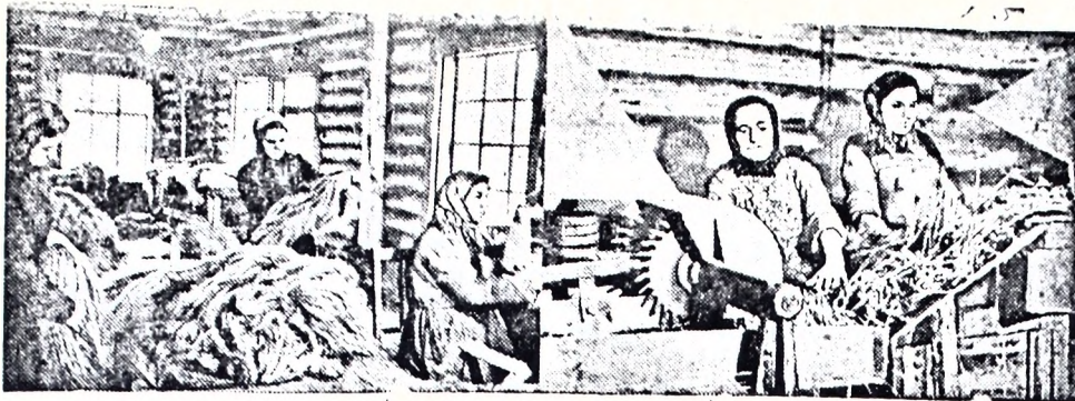
Хороший лер вырастили в текущем году колхозники Мясинского района. Перемыслили план сдачи государству семян льна и тресты, колхозы получили за сданную продукцию более 12 миллионов рублей и поставили себе задачу слать государству тресты и семена еще на 2 миллиона рублей. Успешно работает и коллектив Ватранского льнозавода. Получив большое количество льнотресты, рабочие обязались выработать до конца года сверх годового плана семьдесят тонн высококачественного длинного волокна.