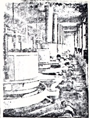
Азербайджанская ССР. Реконструкция Ленкоранской чайной фабрики и освоение ее новой техникой дало возможность увеличить мощность предприятия в четыре раза. Коллектив фабрики досрочно выполнил годовую план.

На снимке: в роллерном цехе чайной фабрики.