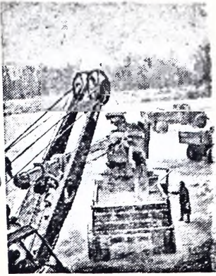
Удмуртская АССР. На строительстве Воткинской ГЭС ведутся подготовительные работы. Идет прокладка железнодорожной линии от станции Кварсы, сооружается автомагистраль протяженностью 23 километра. На снимке: погрузка грунта экскаватором в автомашины для отправки на строительство автомагистрали Воткинской ГЭС.