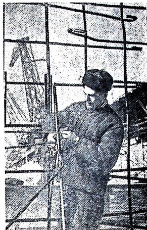
Строителям Новосибирской гидроэлектростанции в нынешнем году предстоит уложить 290 тысяч кубометров бетона, произвести налив в русловую и левобережную части плотины большого количества грунта, смонтировать 7.600 тонн металлоконструкций.

К 1960 году в Караганде гидравлическим способом будет добываться около пятнадцати процентов угля.