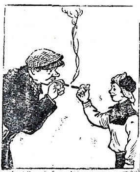
— А ну, где у тебя папираса?!