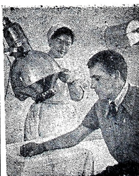
Омская область. В новом зерносовхозе «Южный», созданном на целинных землях Русско-Полянского района, открылась участковая больница.