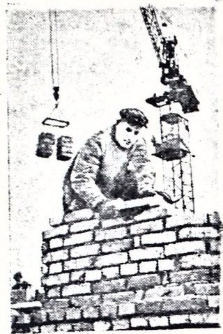
Много новых зданий построено и строится в городе Вологде. На Большой Октябрьской улице ведется строительство здания общежития областной партийной школы.