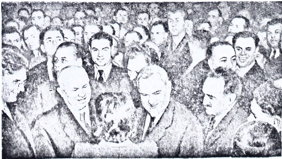
Москва. XX съезд Коммунистической партии Советского Союза. На снимке: члены Президиума съезда во время перерыва между заседаниями среди делегатов съезда.