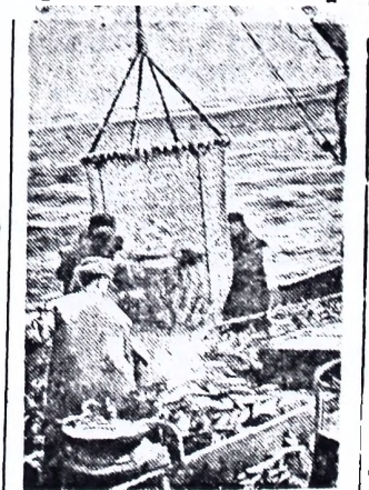
Москва сегодня. Вид на город из Кремля.

Коллегия Министерства электростанций СССР утвердила проектное задание на строительство Днепродзержинской ГЭС. Утвержденная мощность Днепродзержинской ГЭС — 350 тысяч киловатт вместо 250 тысяч, как намечалось раньше. В здании ГЭС будет установлено 8 агрегатов по 43,5 тысячи киловатт каждый. Таким образом Днепродзержинская ГЭС по своей мощности превзойдет Каховскую.