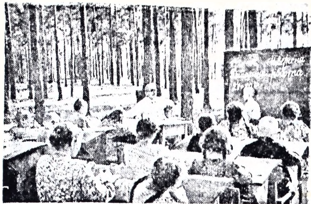
Ровенская область. В живописном уголке соснового бора под Сарнами расположилась лесная школа-интернат. Здесь живут и учатся 50 мальчиков и девочек — учащихся первых — четвертых классов. В лесной школе имеется 20 спальных, 4 учебных комнаты, просторная столовая. Весь день дети находятся под наблюдением врачей, педагогов и воспитателей. На снимке: занятия учащихся 2-го класса на свежем воздухе.