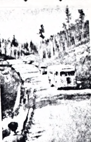
Иркутская область. В районе строительства Братской ГЭС ведутся большие работы по сооружению подъездных путей, строительству жилья. На снимке: новая дорога, связывающая Братск с поселком Падун.