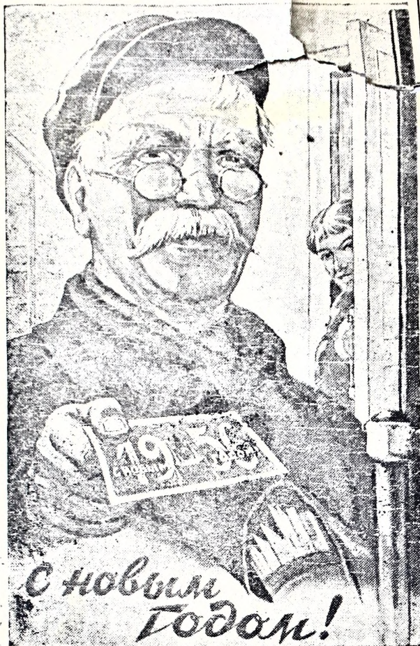
Плакат художника В. Корецкого.

В марте Валентину Постникову перевели на