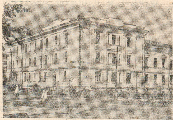
Новое административное здание областного совета по улице Урицкого в Вологде.