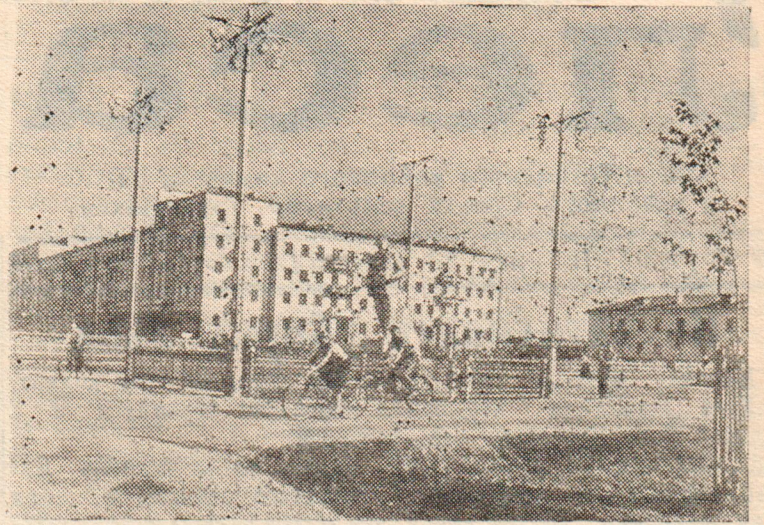
На Вологодском льнокомбинате в нынешнем году ведутся большие работы по благоустройству территории предприятия и рабочего поселка.

На снимке: на одной из улиц рабочего поселка.