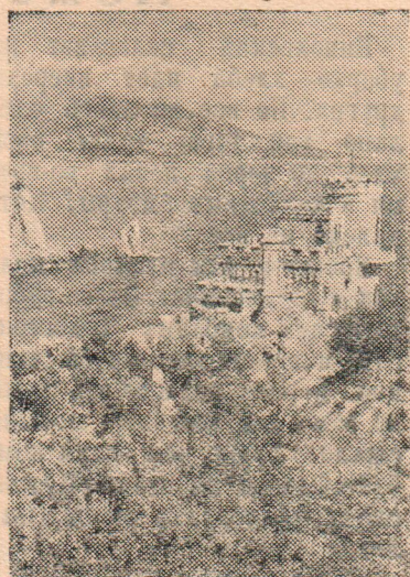
Южный берег Крыма. «Ласточкино гнездо».