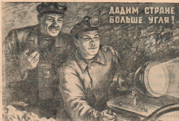
Плакат художника К. Крылова, выпущенный издательством «Искусство».